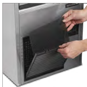
Snadné čištění filtru kondenzátoru