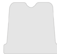
(M) Medium Gourmet 20 g / Ø 30 mm / V 34 mm